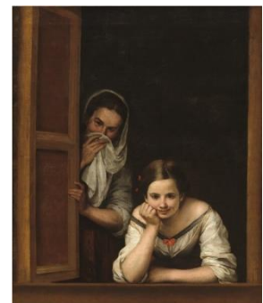
Figura 1. Bartolomé Esteban Murillo (1655/1660). Two Women at a Window. [Pintura]. National Gallery of Art. Disponible en: https://www.nga.gov/collection/art-object-page.1185.html . Consultado: 12/11/2020.

Pedro G. Romero en su artículo Un pintor conceptista (2016), explica que “Hegel, en su Estética , considera a Murillo como el primer artista moderno”.