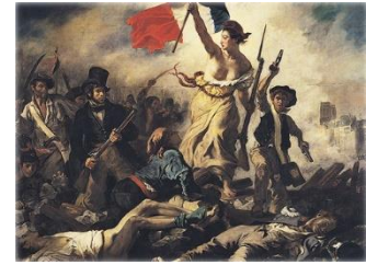
Figura 4. Eugène Delacroix (1830). La Liberté guidant le peuple. [Pintura]. Wikimedia Commons. Disponible en: https://commons.wikimedia.org/wiki/File:La_libertad_guiando_al_pueblo.png . Consultado: 13/11/2020.

Nietzsche da valor al cuerpo, a la persona, al aquí y ahora; no al cielo prometido. Así como en el caso de los escritores, los artistas deben conocerse y expresarse a sí mismos (Silenzi, 2005).